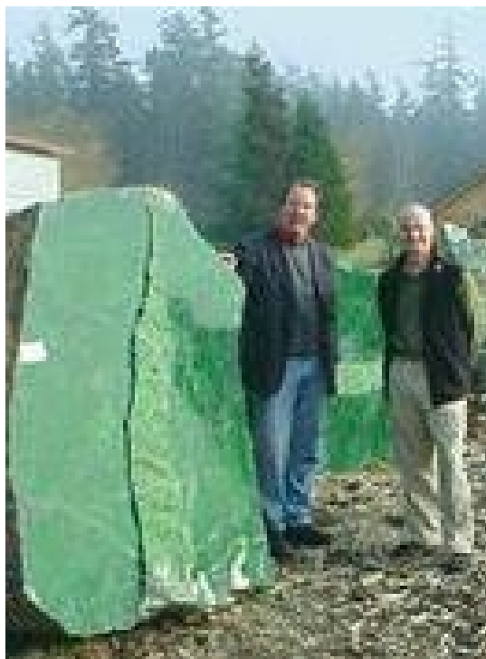
Khí i ngộ c th ch

T&#225;c Gi&#7843;: Giao Ch, San Jose Th&#7913; B&#7843;y, 02 Th&#225;ng 10 N&#259;m 2010 21:56