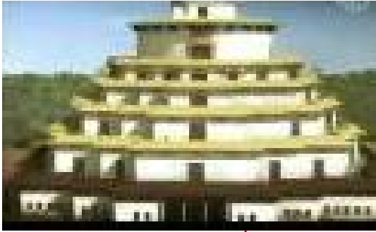
Đồ tháp ở chùa ở Úc

Th&#7913; B&#7843;y, 02 Th&#225;ng 10 N&#259;m 2010 21:56