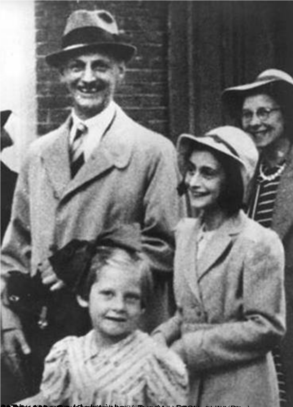
1971, Anne Frank và gia đình ở New York City (Đ ̣n): Axia Chapple, nhà ̣ ̣ng 1971, Anne Frank và gia đình ở New York City (Đ ̣n): Axia Chapple, nhà ̣ ̣ng

T&#225;c Gi&#7843;: Vietsciences- Ph ̣ m Văn Tu ̣ n - V ̣ Th ̣ Di ̣ u H ̣ ng Th&#7913; N&#259;m, 30 Th&#225;ng 4 N&#259;m 2009 23:16