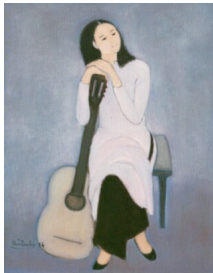
Khúc Giao Hưởng, 1994.

Ph i c nén c n b c t c: b n ph n đang ch i h u c và trách nhiệm cũng đang đ i tôi n i chiến tuyền!