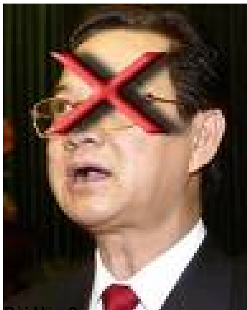
Bài H&a 8