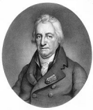
Claude Louis Berthollet

Ông là ng i tìm ra nhi u quy trình hoá h c áp d ng trong th c t công nghi p nh : Ph ng pháp t y tr ng v i, sáp, b t gi y b ng clo; ph ng pháp nhu m... Ông m t năm 1822.