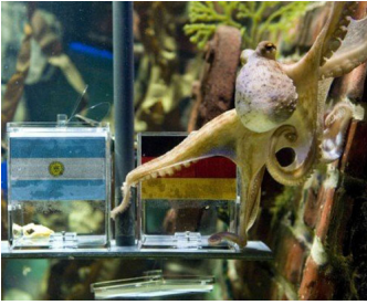
Đốc đoán Đốc thắng Argentina hôm 29/6

Th&#7913; N&#259;m, 08 Th&#225;ng 7 N&#259;m 2010 09:16