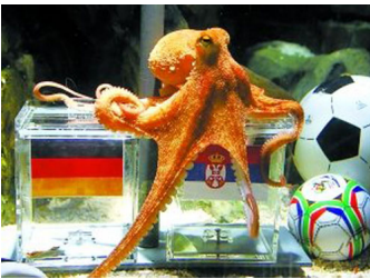
Bích tuấn Paul đoán trận Đốc gặp Serbia