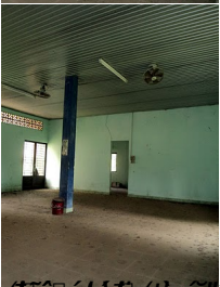
Ảnh 2: Hình ảnh chụp từ trong của công trình (bên trong) của Nghĩa Trang Quân Đ o i Biên Hòa, Ti o ng K o u Kh o n Thi o t T o Ng o i Đ o n Thi o ng, có chiều cao 20m.