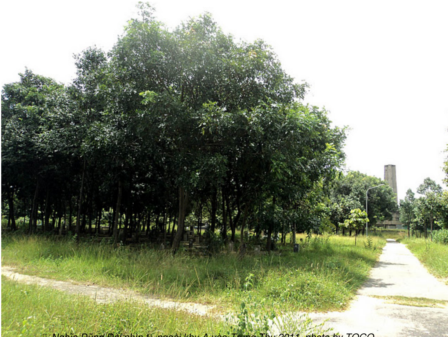
▣ Nghĩa D o ng Đ o i nhìn ▣ ngoài khu A vào-Trung Thu 2011

Th&#7913; S&#225;u, 07 Th&#225;ng 10 N&#259;m 2011 00:00