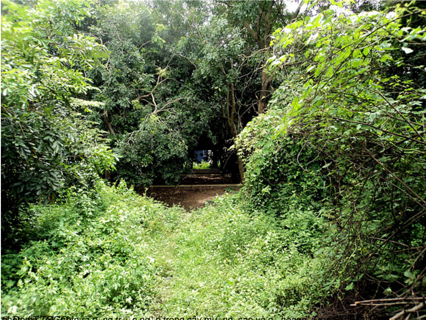
ph o to by T&#8033;G&#8033;O hin ra c&#225;ng tr&#225; c&#225;ng p trong c&#225;y mu&#225;ng, sao v&#225; c&#225; hoang, Trung Thu 2011,

Th&#7913; S&#225;u, 07 Th&#225;ng 10 N&#259;m 2011 00:00