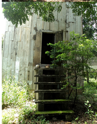
Đền thờ chân Nghĩa Dũng Đài.-Trung Thu 2011