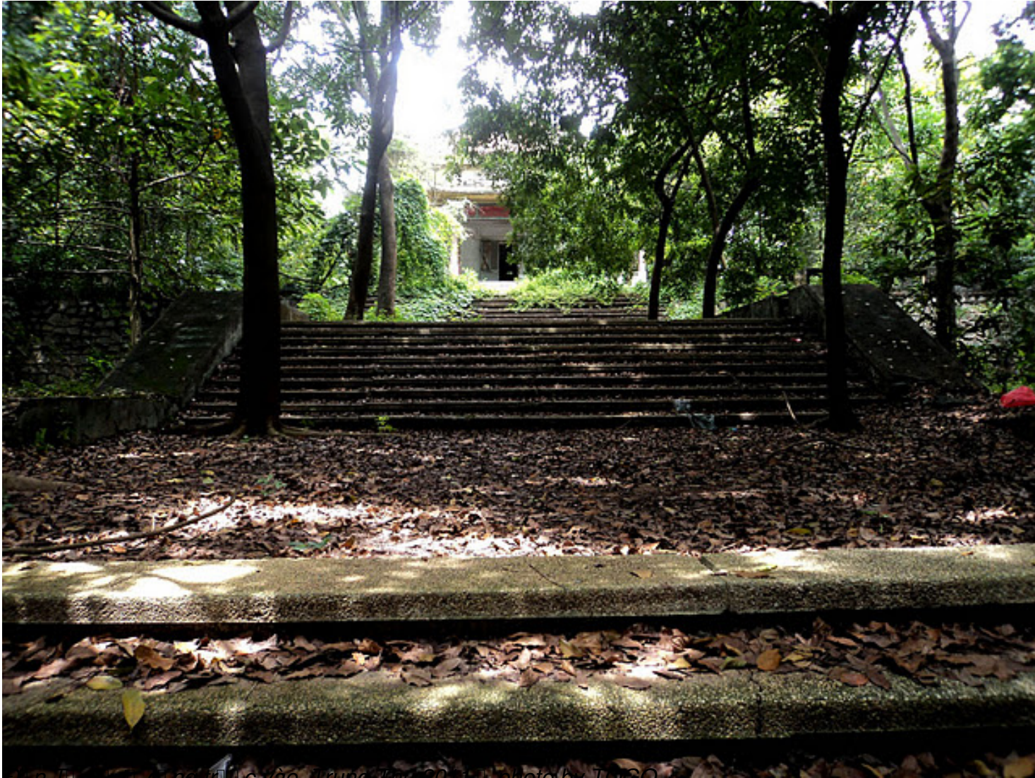
Đền thờ Sĩ tử cũng bị bỏ rơi, Trung Thu 2011

Th&#7913; S&#225;u, 07 Th&#225;ng 10 N&#259;m 2011 00:00