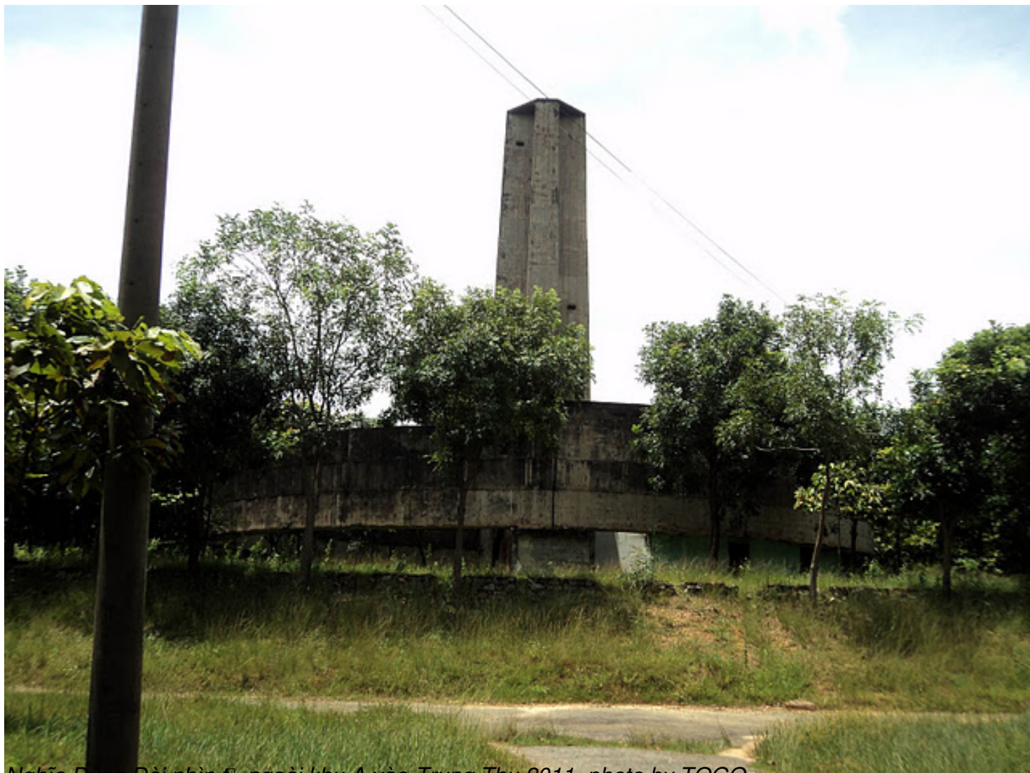
Nghĩa Đ o ng Đ o i nhìn từ ngoài khu A vào-Trung Thu 2011

Th&#7913; S&#225;u, 07 Th&#225;ng 10 N&#259;m 2011 00:00