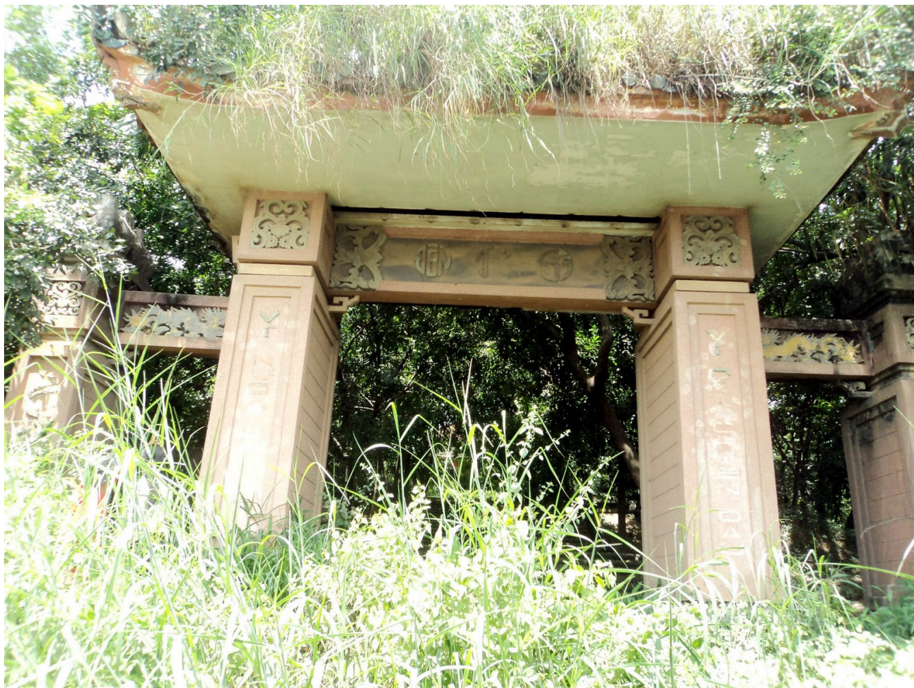
Cổng Tam Quan Đ❏n Tử Sĩ ng❏p trong cỏ, vì đang là mùa mưa, Trung Thu 2011

Th&#7913; S&#225;u, 07 Th&#225;ng 10 N&#259;m 2011 00:00