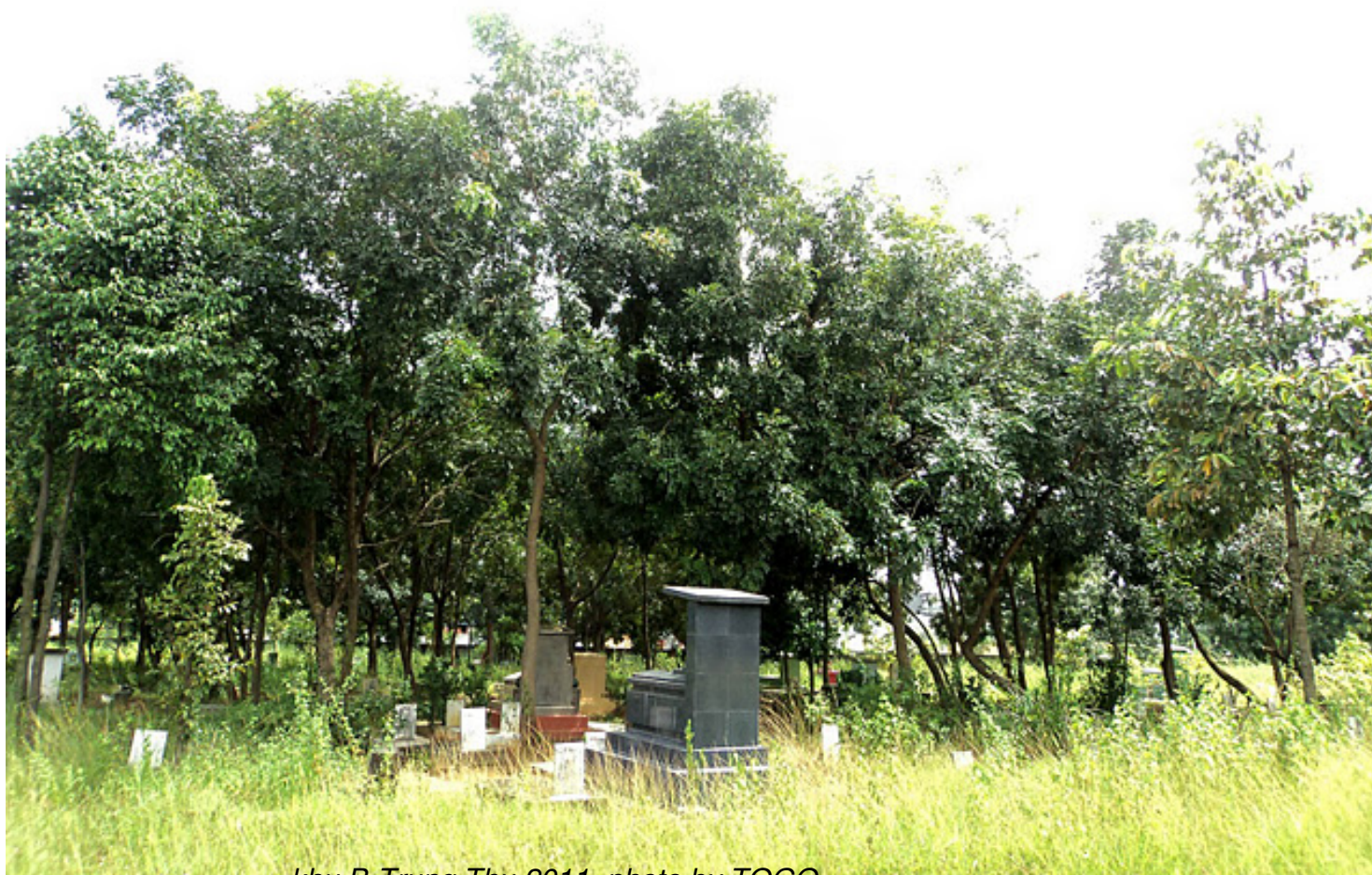
khu B-Trung Thu 2011

Th&#7913; S&#225;u, 07 Th&#225;ng 10 N&#259;m 2011 00:00