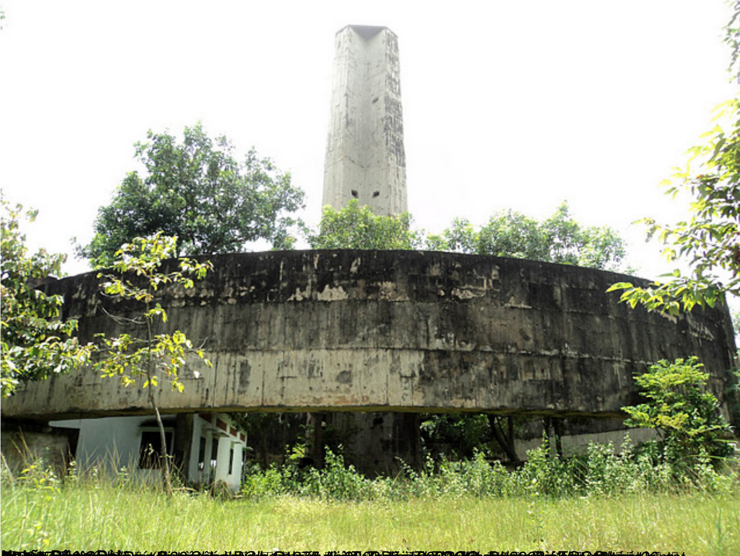
Ảnh 1: Bức ảnh chụp từ ngoài của công trình (bên ngoài) của Nghĩa Trang Quân Đ o i Biên Hòa, Ti o ng K o u Kh o n Thi o t T o Ng o i Đ o n Thi o ng, có chiều cao 20m.

T&#225;c Gi&#7843;: Lê Tùng Châu Th&#7913; S&#225;u, 07 Th&#225;ng 10 N&#259;m 2011 00:00