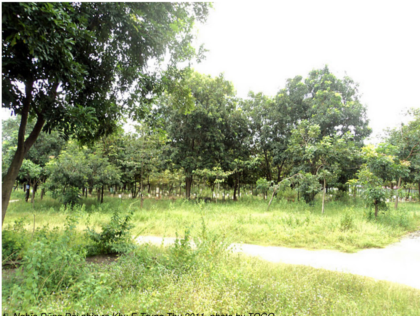
▣ Nghĩa D o ng Đ o i nhìn ra Khu E-Trung Thu 2011

Th&#7913; S&#225;u, 07 Th&#225;ng 10 N&#259;m 2011 00:00