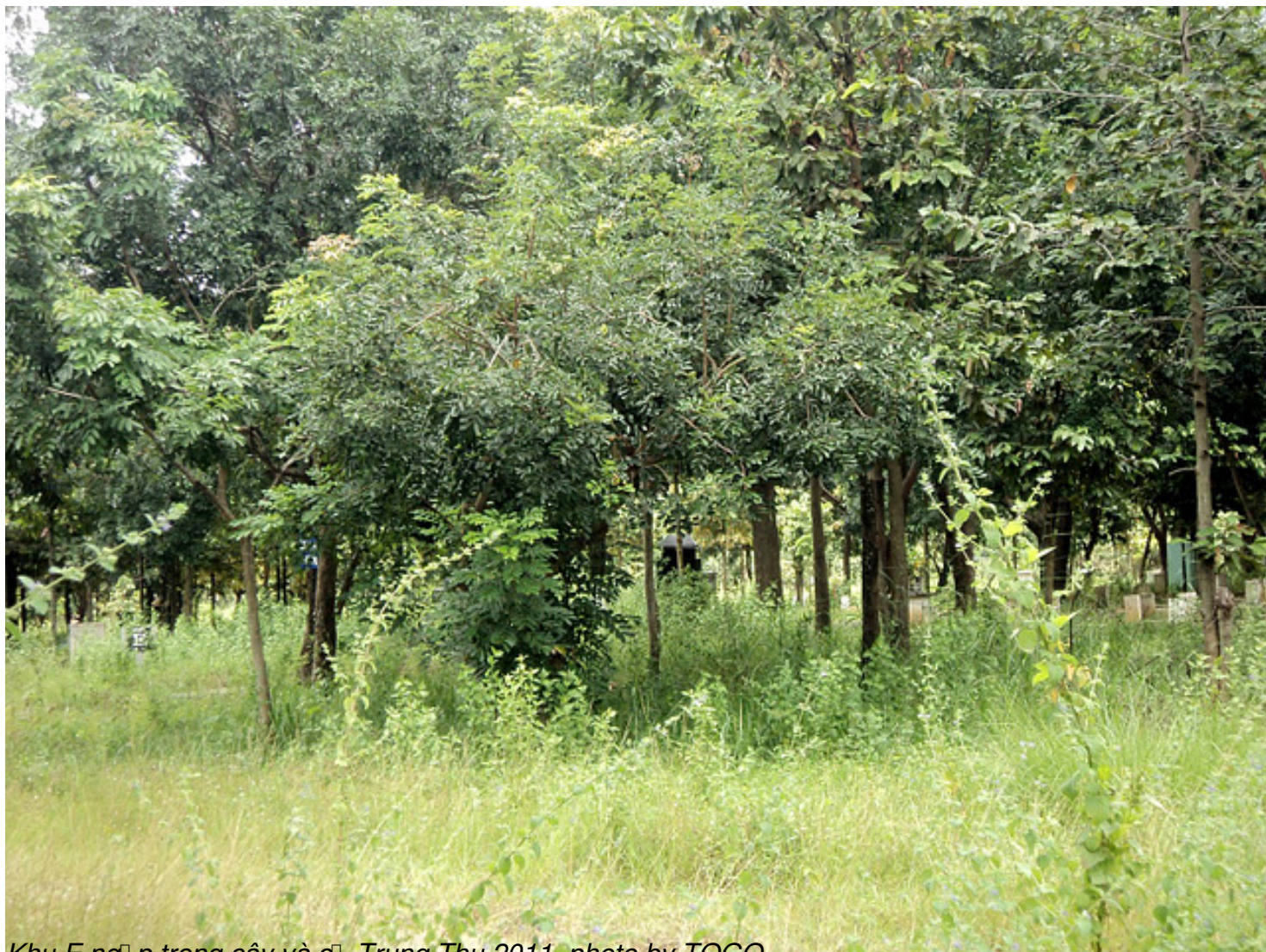
Khu E ngp trong cây và c -Trung Thu 2011, photo by TQGO

Th&#7913; S&#225;u, 07 Th&#225;ng 10 N&#259;m 2011 00:00