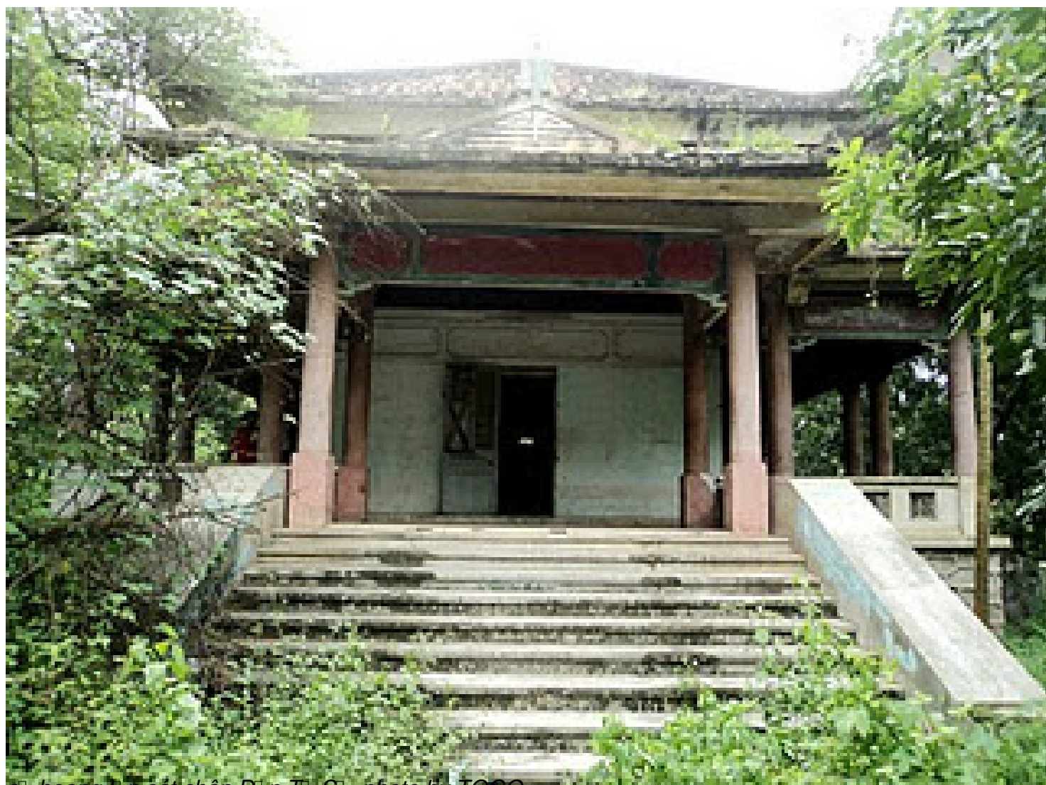
♣ hoang nh sát chân Địch Tiếng S, photo by TQGO

Th&#7913; S&#225;u, 07 Th&#225;ng 10 N&#259;m 2011 00:00