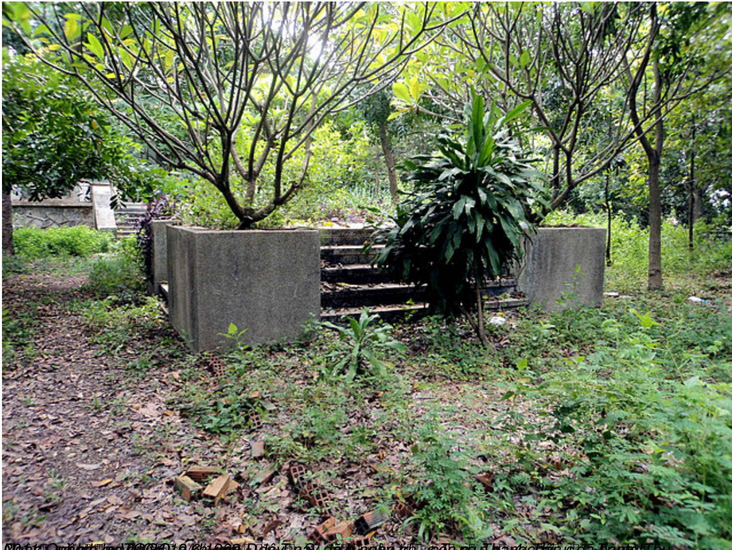
Ngày: 10/10/2011 00:00 Đây là ảnh chụp công trình đang xây dựng của Công ty