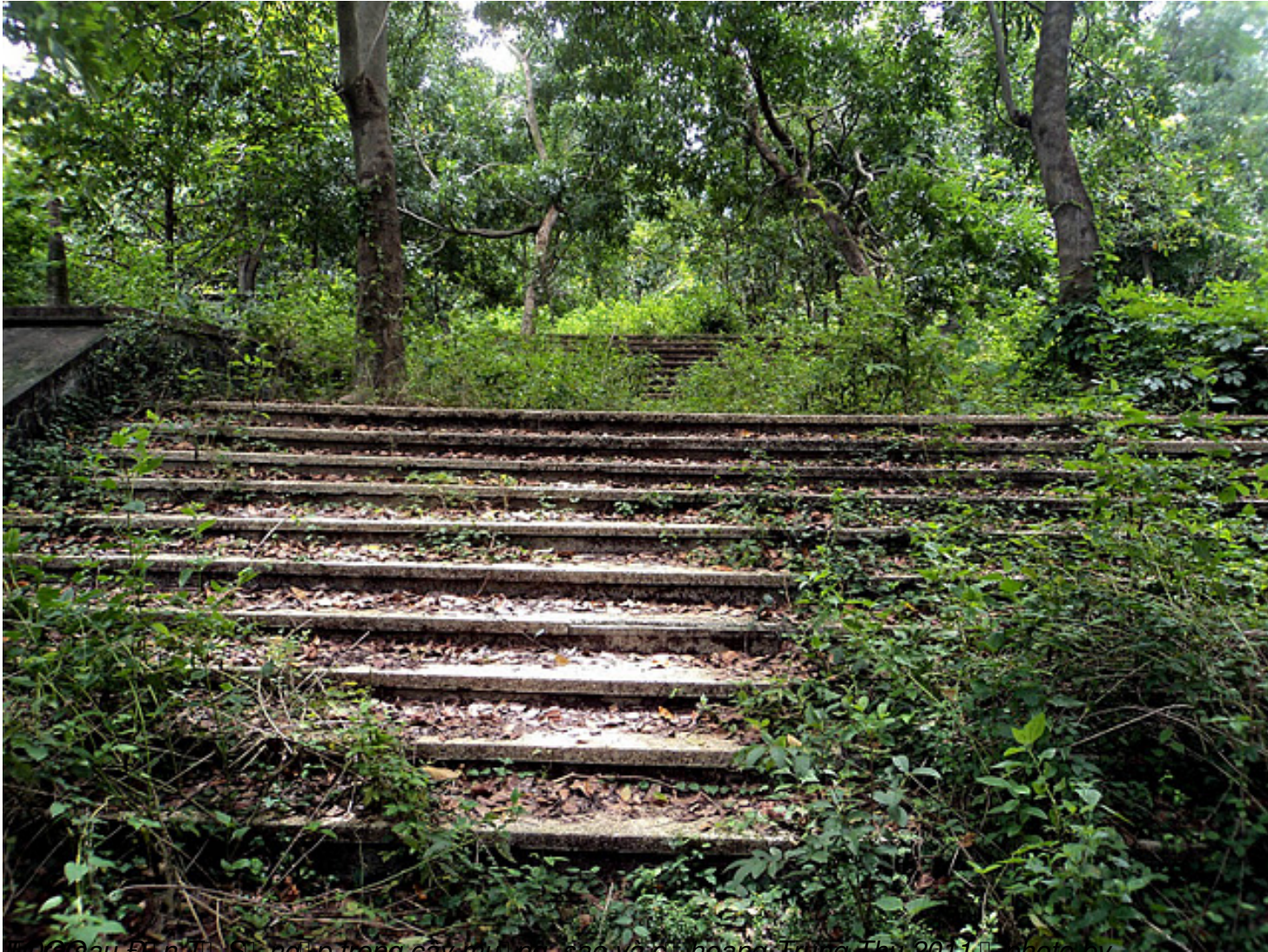
Đền Sau Địch Trận Sĩ ngã p trong cây mầu ng, sao và cở hoang Trung Thu 2011, photo by

Th&#7913; S&#225;u, 07 Th&#225;ng 10 N&#259;m 2011 00:00