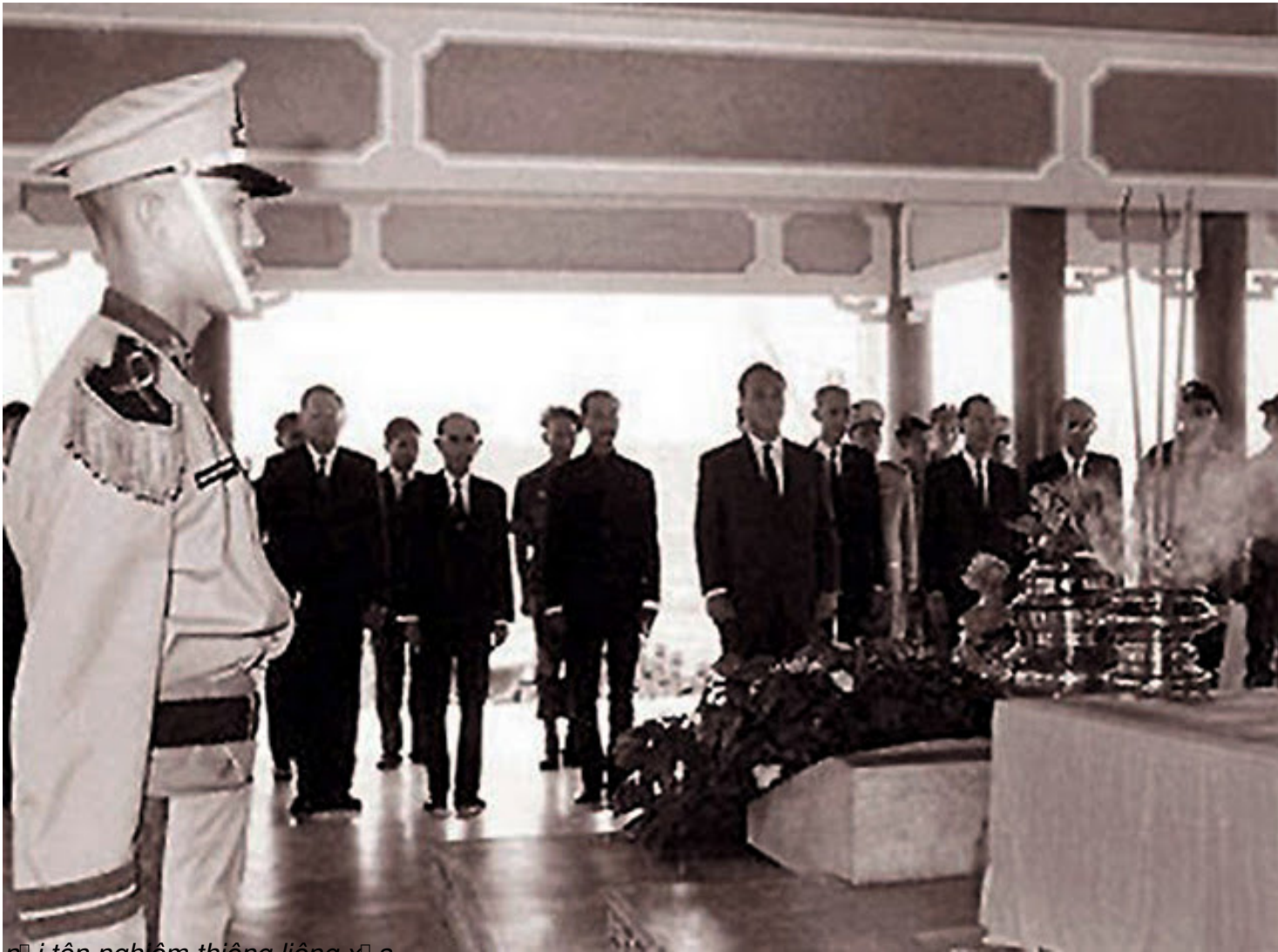
n h i t o n nghi m thi eng li eng x u a...