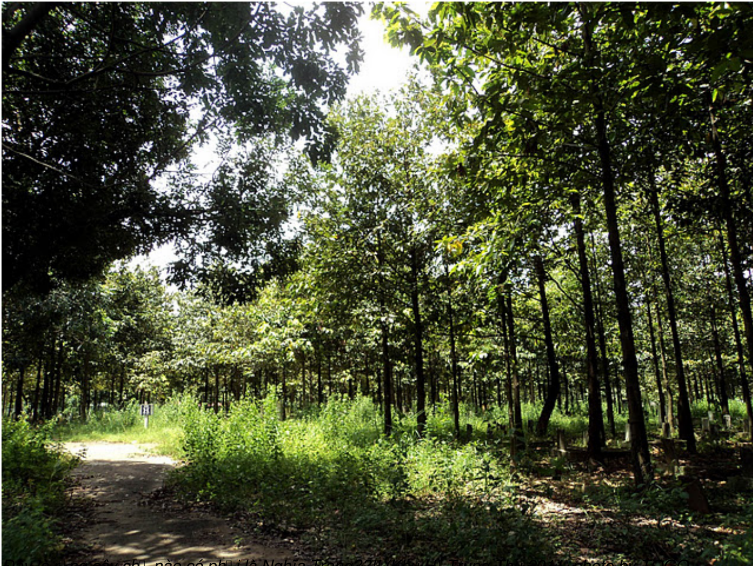
Đây là rừng cây ch o nào có ph o i là Nghĩa Trang?!! (Khu 11)-Th o ng Th o 2011

Th&#7913; S&#225;u, 07 Th&#225;ng 10 N&#259;m 2011 00:00