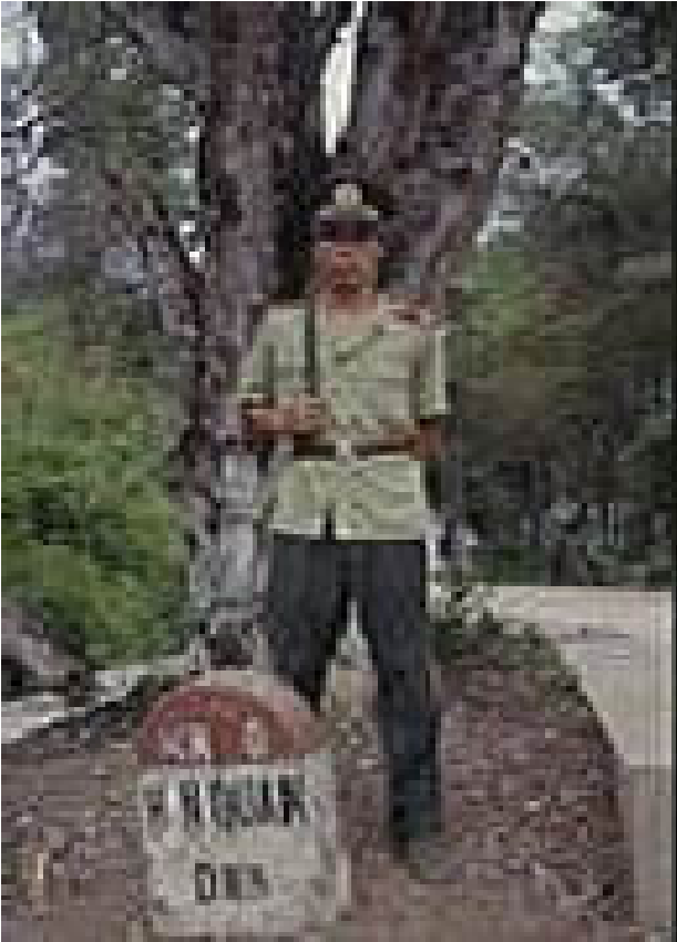
Hình G25. "Km0" trong nh&#225;ng năm 1990. Biên phòng VN đ&#225;ng gác nh&#225;ng quay m&#225;t v&#225; phía VN. Đáng nh&#225;!

T&#225;c Gi&#7843;: Saigon Echo s&#225;t m Th&#7913; S&#225;u, 04 Th&#225;ng 12 N&#259;m 2009 15:21