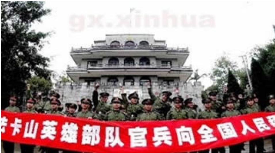
Hình G43 Các chiến binh trong chiến tuyến biên giới Trung-Việt hành quân

T&#225;c Gi&#7843;: Saigon Echo s&#225;u t&#225;m Th&#7913; S&#225;u, 04 Th&#225;ng 12 N&#259;m 2009 15:21