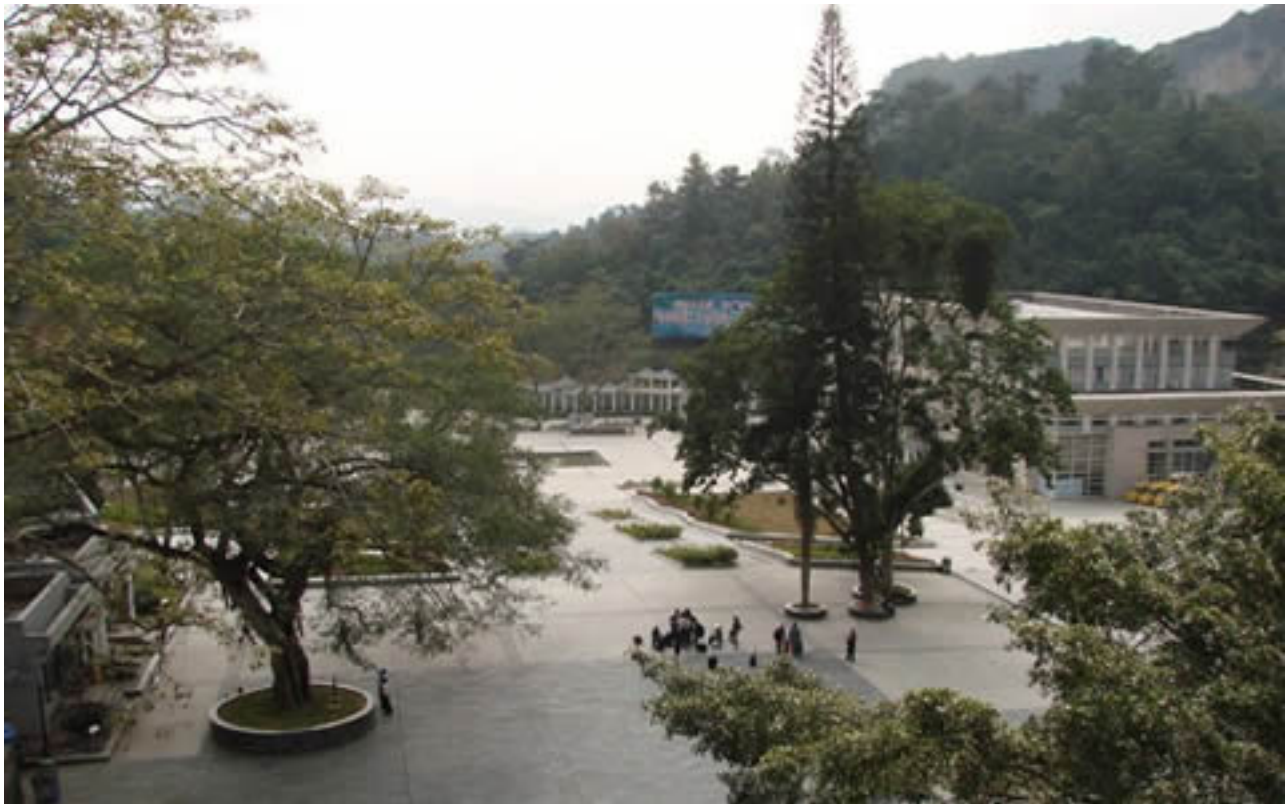
Hình G7. Cây si PVD nhìn từ trên lầu thành Hồ u Ngh Quan. Công nhà trồng là Hồ i Quan TC xây ở trên nền "nhà tròn". Xa th m bên kia là công t Km0 hiện t i.

- Ngày 09.04.1961, Chu Ân Lai và Hồ Chí Minh “hội đàm” tại lầu 2 công a cũ thành Phố Nam Quan. “Hội đàm” về nội dung gì thì công hai bên đều không công bố. Chỉ biết rằng cuộc “hội đàm” mà ám chỉ ở Phố Nam Quan công hai lãnh đạo công ng số n Trung-Việt được công bố trong sách giáo khoa công a bản Trung Công là “mở ra một trang số mới cho quan hệ Trung-Việt”.