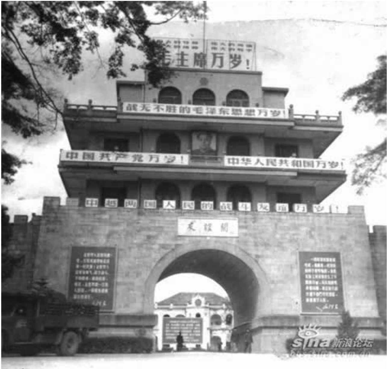
Hình G11. So sánh với hình ảnh Mặt Nam Quan năm 1959. Đoàn đi biên của CSTC đã phép chập

- Ngày 05.03.1965, Quốc gia Việt Nam Trung Cộng và chính phủ CSVN có hành động đổi tên “Mặt Nam Quan” thành “Hữu Nghị Quan”. Tham vọng phía bên Việt Nam có Trung Cộng lãnh sự VN trú tại Nam Ninh và đoàn chính phủ VN đến thăm Lãnh sự VN. ...Và kể từ sau đó, chính phủ CSVN đã dâng trả tên Nam Quan cho Trung Cộng để tiếp nhận vị trí trên vũ khí tiến đánh miền Nam-Việt Nam Cộng Hòa. Hình G10. Hữu Nghị Quan năm 1965. Biểu ngữ của TC và hình Mao Trạch Đông phôi vào phần lãnh thổ VN