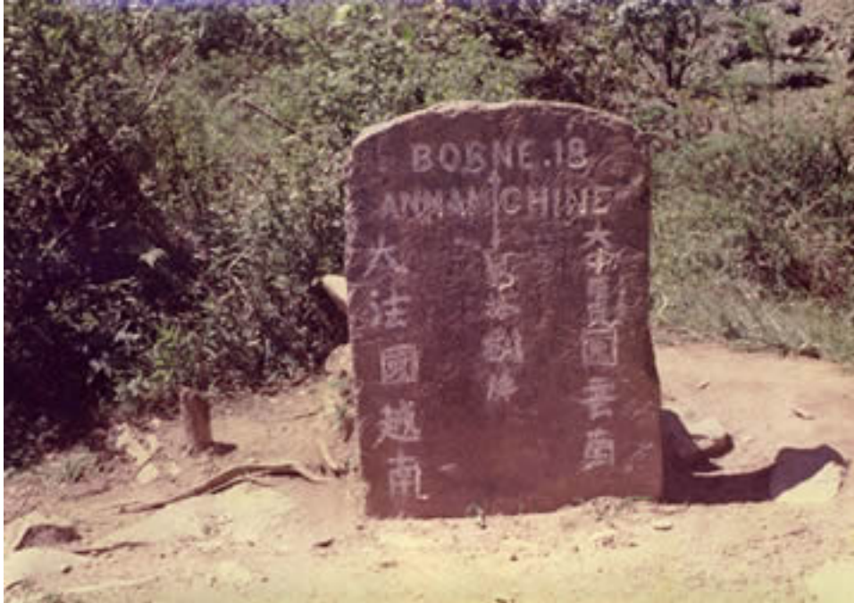
Hình G23. Ph i nh tham kh o "C i t M i c S i 18" gi o m o (?)

- Ngày 28.05.1980, Trung-Vi t ti n hành trao tr i tù binh t i "Km0" trên đ i ng Đ i ng Đ i ng d i n vào khu v i c H u Ngh i Quan