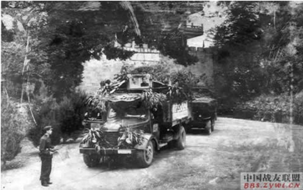
Hình G17. Năm 1968, H&#225; - Mao đi t&#225; ở Miền Nam Quan cùng mang vũ khí vào gây tang tóc cho dân miền Nam VN

T&#225;c Gi&#7843;: Saigon Echo s&#225;u t&#225;m Th&#7913; S&#225;u, 04 Th&#225;ng 12 N&#259;m 2009 15:21