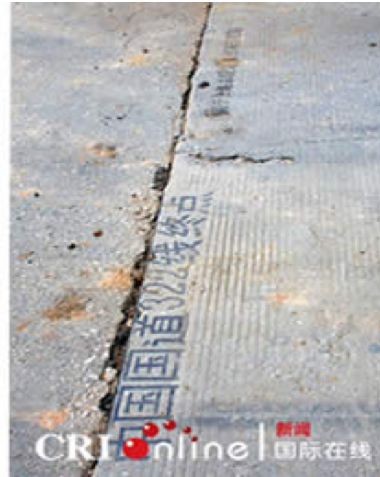
Hình G31 Ngang với "Km0" là giao điểm Quốc lộ 322 (điểm cuối) của TC và Quốc lộ 1A (điểm khởi đầu) của VN!

"Trung Quốc Quốc lộ 322 Chung Kí t Điểm"