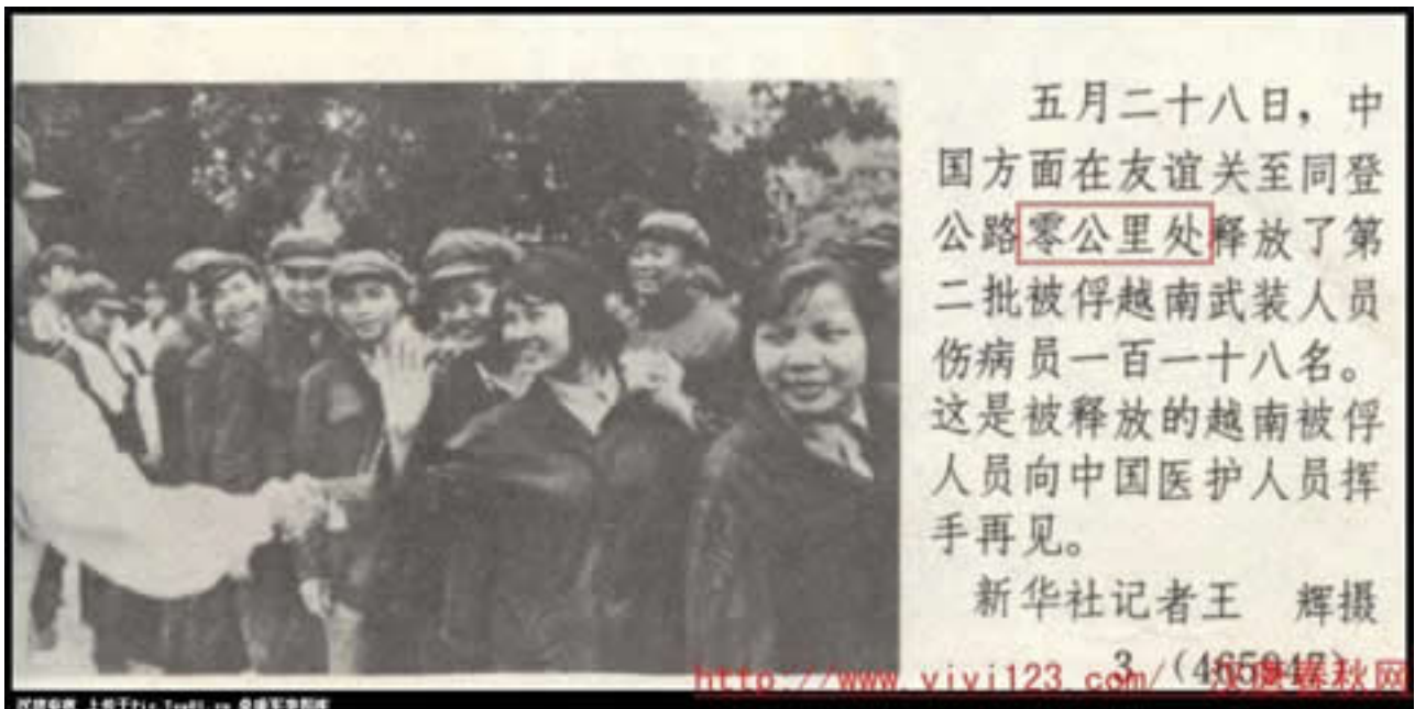
Hình G22. Trao tr tù binh