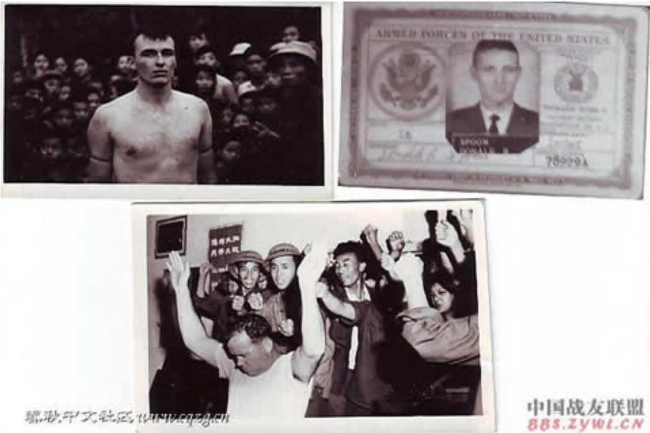
Hình G14. Tham gia tra tấn tù binh Mỹ tại VN

T&#225;c Gi&#7843;: Saigon Echo s&#228;u t&#228;m Th&#7913; S&#225;u, 04 Th&#225;ng 12 N&#259;m 2009 15:21