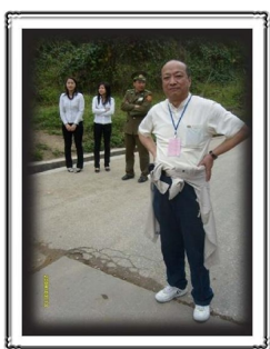
Hình G37 Khách du lịch Trung Quốc thò tay thò chân qua rào, nhìn nhà như nhà. Chợ hình gì? Chuyện như thế! Đố tên biên phòng VN nào dám làm khó dễ!

Còn những vị Việt Nam? Có ai dám cầm tay những người ra chợ tại khu vực này hay không? Thi nhân Bùi Minh Quốc bị cầm tay vì hình ô nhục của Trung-Việt. Nhà báo Điếu Cày có mặt tại chợ tại Thác Bản Giốc mà giờ còn nằm trong Chí Hòa. Và tôi cũng từng bị biên phòng VN hành hung khi tay lẫn le chiếc máy ảnh nhỏ ở vùng biên cảnh "Hữu Nghĩ"!