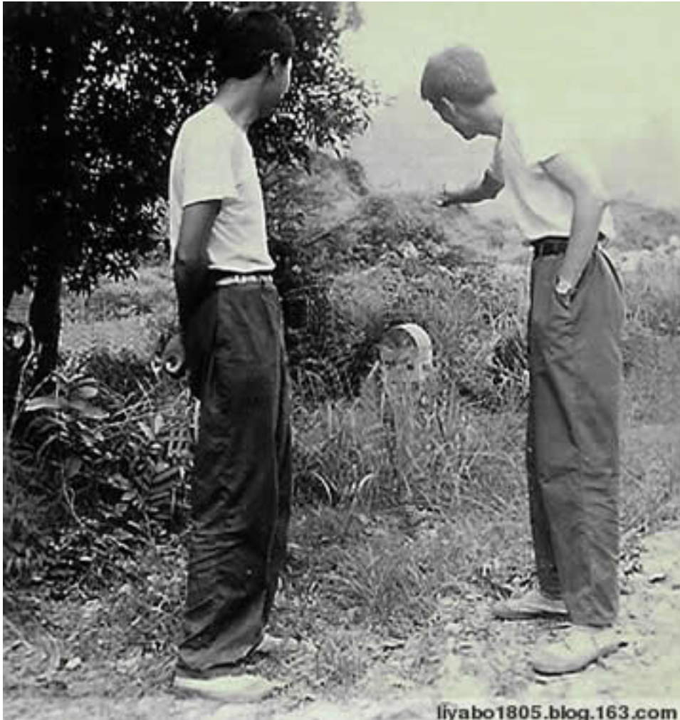
Hình G24 Năm 1979, hai tên Trung Cộng đang ch&# vào v&# trí c&#t m&#c “Km0”.

đ&#c. Còn cây si là cây si nào? Cây si thu&#c lo&#i cây nhi&#t đ&#i có s&#c tăng tr&#ng và phát tán r&#t nhanh. Không th&# nào cho r&#ng cây si mà PVD tr&#ng là cây si đ&#ng sau c&#t “Km0”. Hãy xem hình (so sánh v&#i cây si tr&#c c&#ng HNQ &# ch&#ng II).