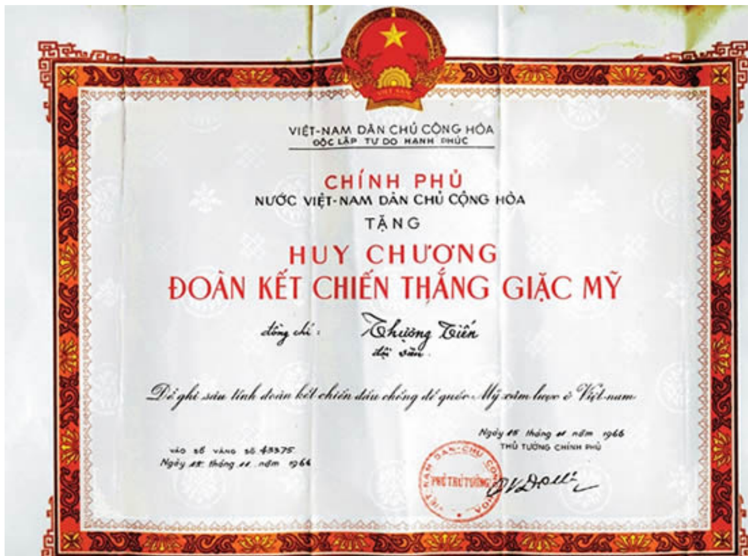
Hình G16. Huy chương "Đoàn Kết Chiến Thắng Giặc Mỹ" do chính HCM ký tặng cho PVĐ ban đầu.