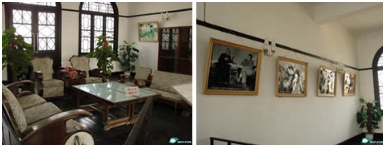
Hình G8. Lưu 2 ở M. C. Nam Quan với nguyên trạng cũ c "hội đàm" giữa C&#228;L và HCM

T&#225;c Gi&#7843;: Saigon Echo s&#225;u t&#225;m Th&#7913; S&#225;u, 04 Th&#225;ng 12 N&#259;m 2009 15:21