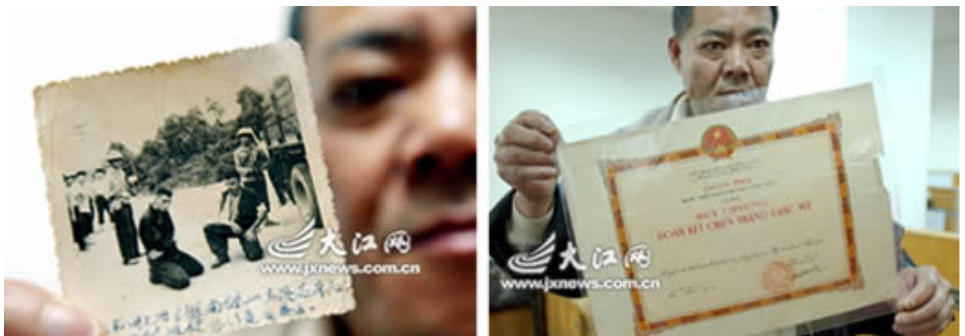
Hình G15. Tham gia bắt sống phi công Mỹ tại VN. Người cầm giấy là cựu chiến binh TC tham chiến tại VN