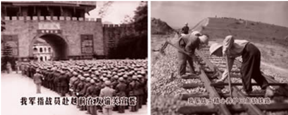
Hình G12. Năm 1966. Công binh xây dựng đường sắt Trung-Việt tại H u Ngh Quan

Năm 1966. Công binh xây dựng đường sắt Trung-Việt tại H u Ngh Quan tuyên thệ trước khi vào VN làm nhiệm vụ và Thiệt độ binh: công binh đường sắt TC giờ đường bộ đi VN