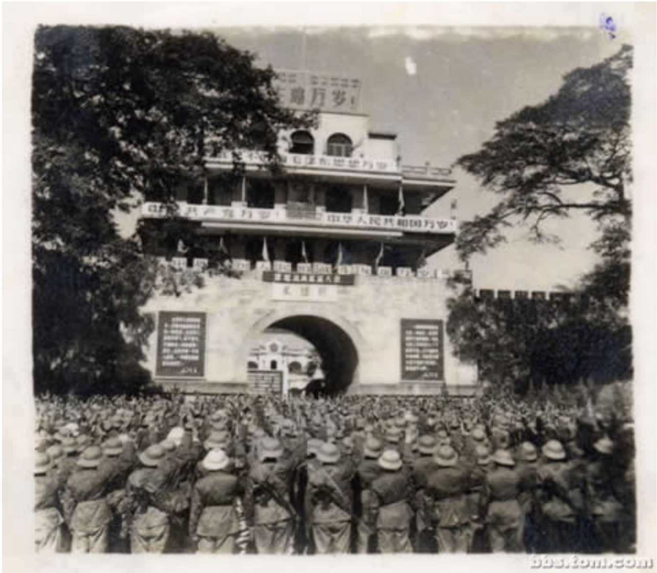
Hình G13. Năm 1966. Quân chính qui TC giở dờng bở đởi VN

Năm 1966. Quân chính qui TC giở dờng bở đởi VN tuyên thở tởi Hở u Nghở Quan. Hở ởng vở TC đởng thanh hồ ởn: "Quyở tở tâm hoàn thành nhiở mở vở. Nguyở n mang vinh quang trở vở!". Trong ởnh là Sở đởn 62 Cao Xở TC)