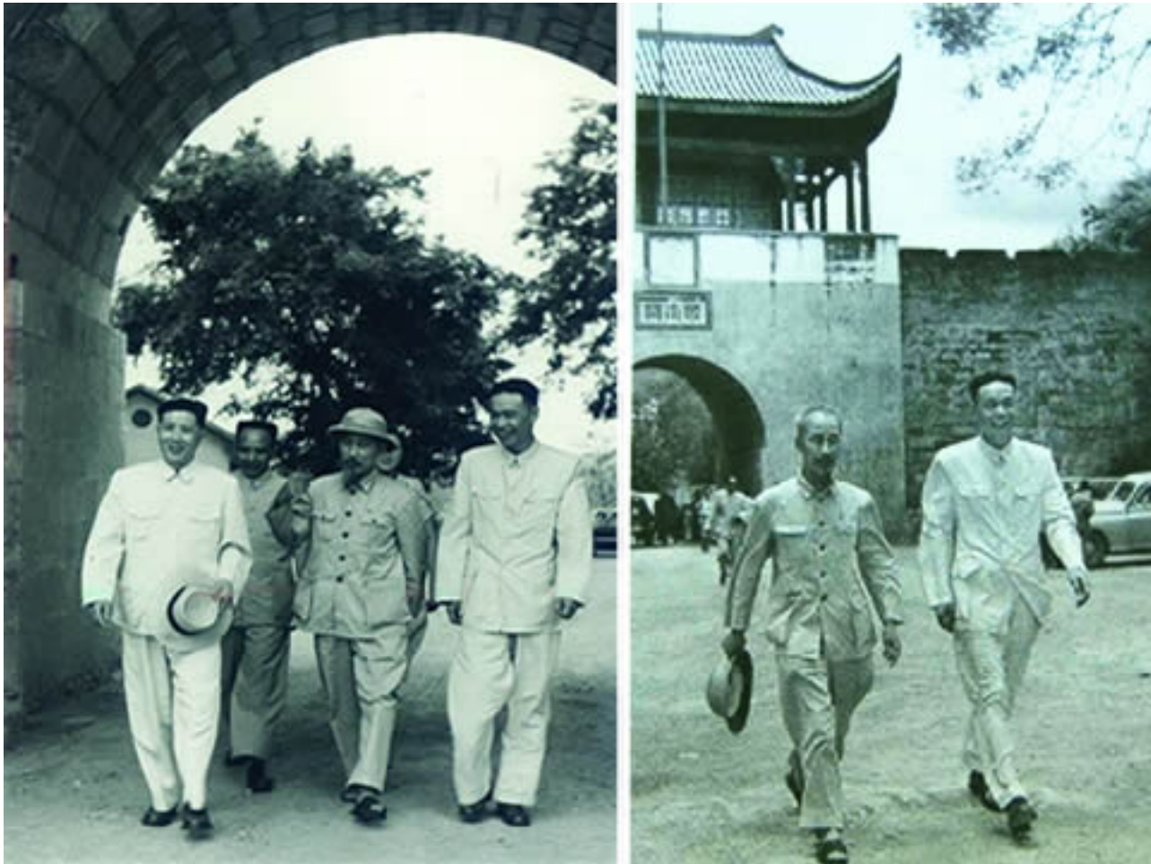
Hình G2. HCM bang giao với TC tại c&#ng Nam Quan trong nh&#ng năm 1950

Việt qua lại giữa hai Đ&#ng CS Trung-Vi&#t liên tục di&#n ra tại c&#ng Nam Quan. Tháng 10 năm 1953, Chính V&# Vi&#n Trung C&#ng đ&#i tên c&#ng Nam Quan thành “M&#c Nam Quan” (ch&# “M&#c” có nghĩa là: hòa thuận, hòa hợp, thân mật, thân thiện...), đ&#ng th&#i c&# hai chính phủ Trung-Vi&#t thành lập Ủy Ban Cửa Kh&#u M&#c Nam Quan. Cùng năm, th&#a thuận theo Chính V&# Vi&#n Trung C&#ng, Việt Nam mở cửa tạm thời cho hai cửa khẩu Bình Nghi – Nam Quan. Năm 1953 đã có 276.000 người qua lại c&#ng Nam Quan giữa hai bên.