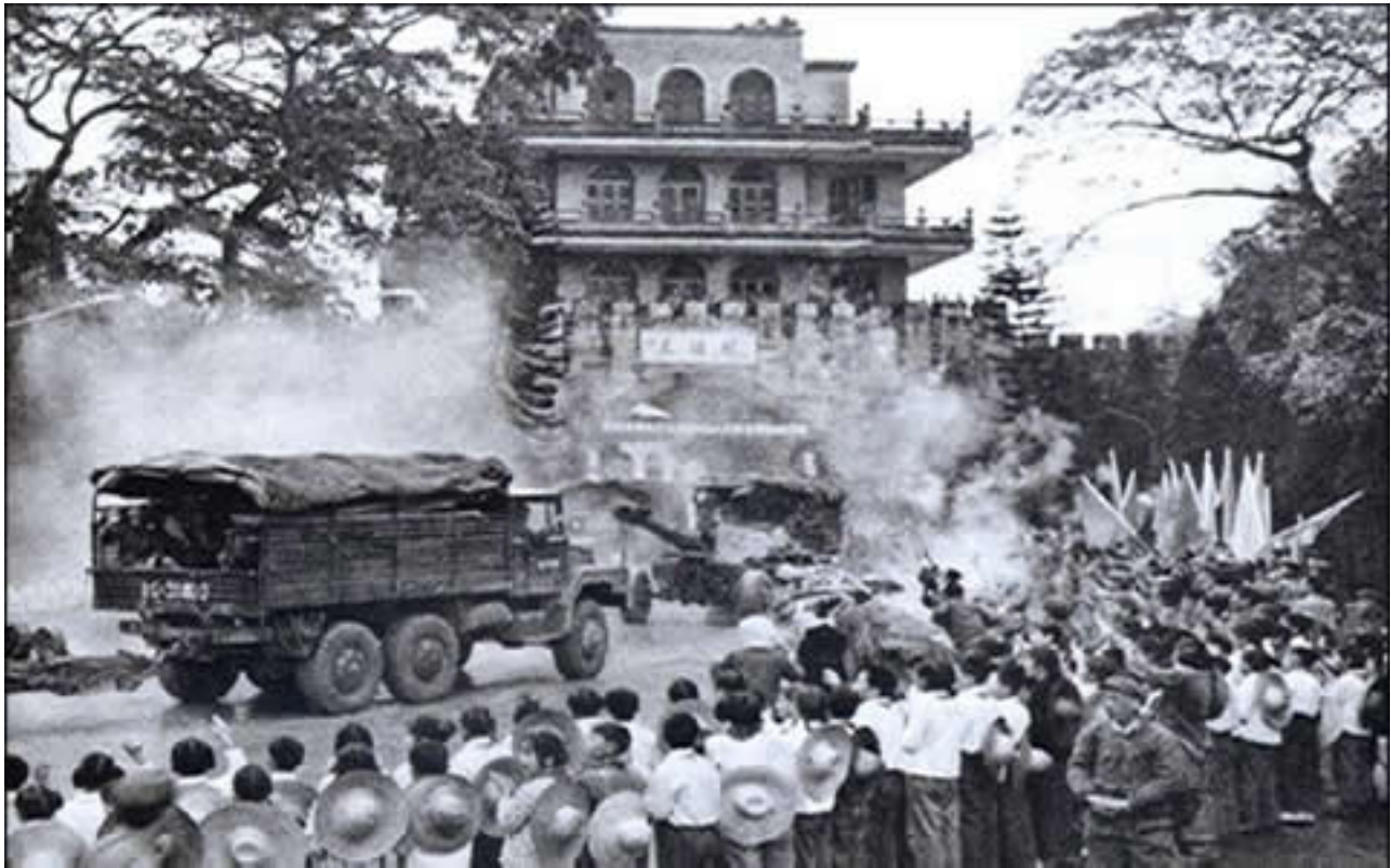
Hình G21. Trung C ng ca khúc kh i hoàn tr v c ng H u Ngh Quan sau chi n th ng