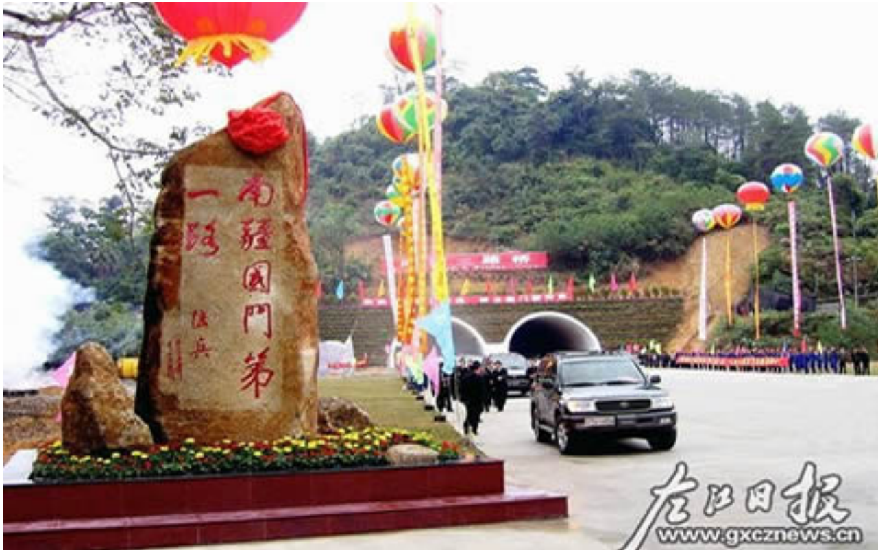
Hình G34 Ngày 28.12.2005, cao tốc Nam Hiep chính thức khai thông nối vào khu vực m Quốc lộ 1A cũ ở Việt Nam