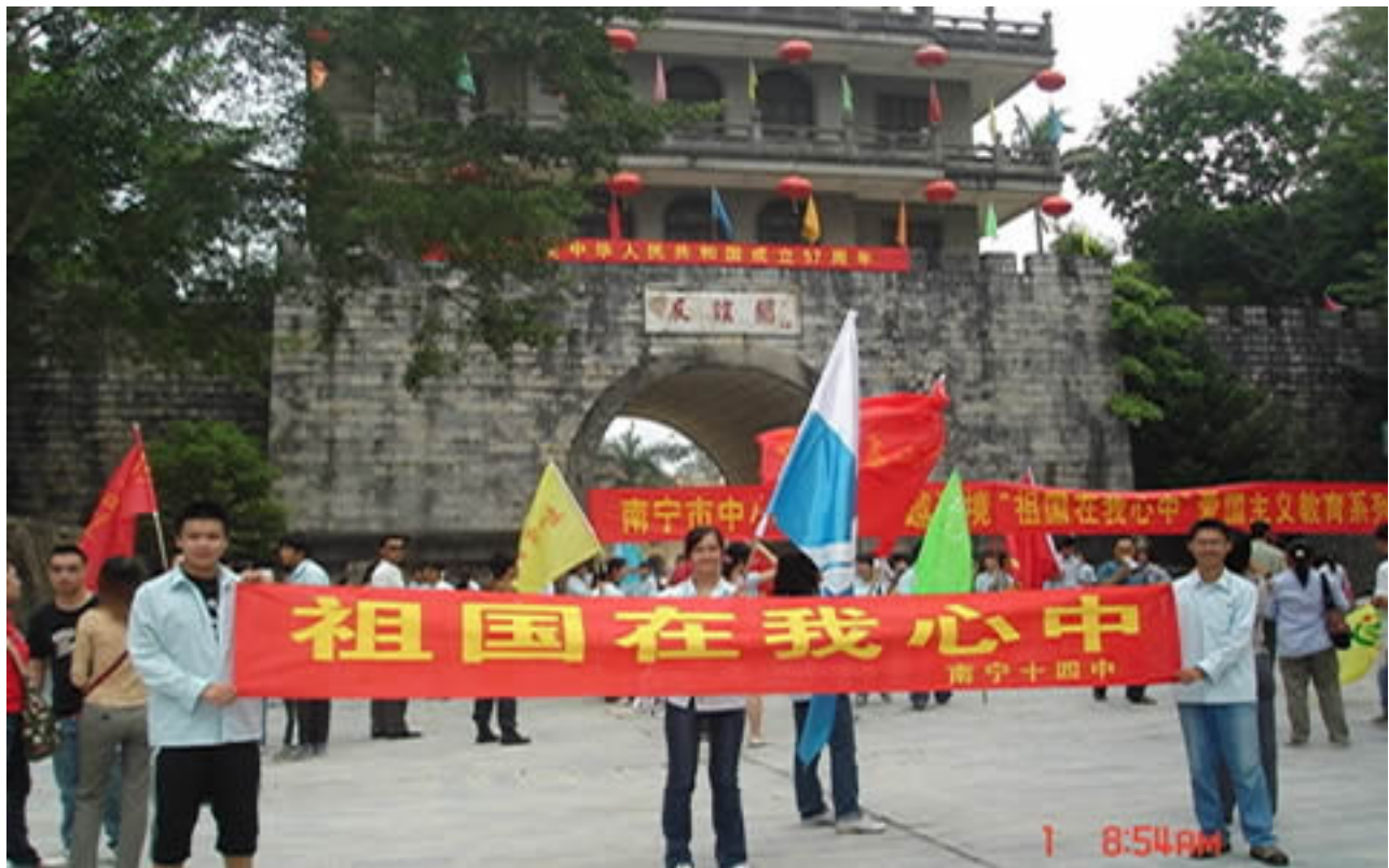
Hình G42 Nhóm học sinh ở Trung Cộng đi ở Nam Quan ngày càng rầm rộ, hoành tráng. Tiếng hát học sinh trên các miền đất nước đã và Hội u Nghị Quan đã nghe giáo dục và lòng yêu nước! "Tổ Quốc Tôi Ngã Tâm Trung" (Tổ quốc trong tim ta)