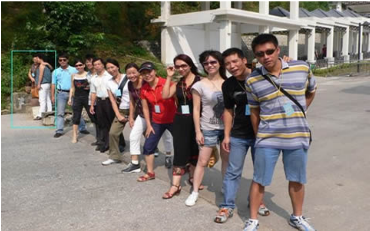
Hình G38 B&#225;c m&#225;t b&#225;c là qua đ&#223;n VN! Hai con x&#223;m trong góc có khung là v&#223; trí c&#223;a Km0 Ô nhiễm!

T&#225;c Gi&#7843;: Saigon Echo s&#225;t m Th&#7913; S&#225;u, 04 Th&#225;ng 12 N&#259;m 2009 15:21