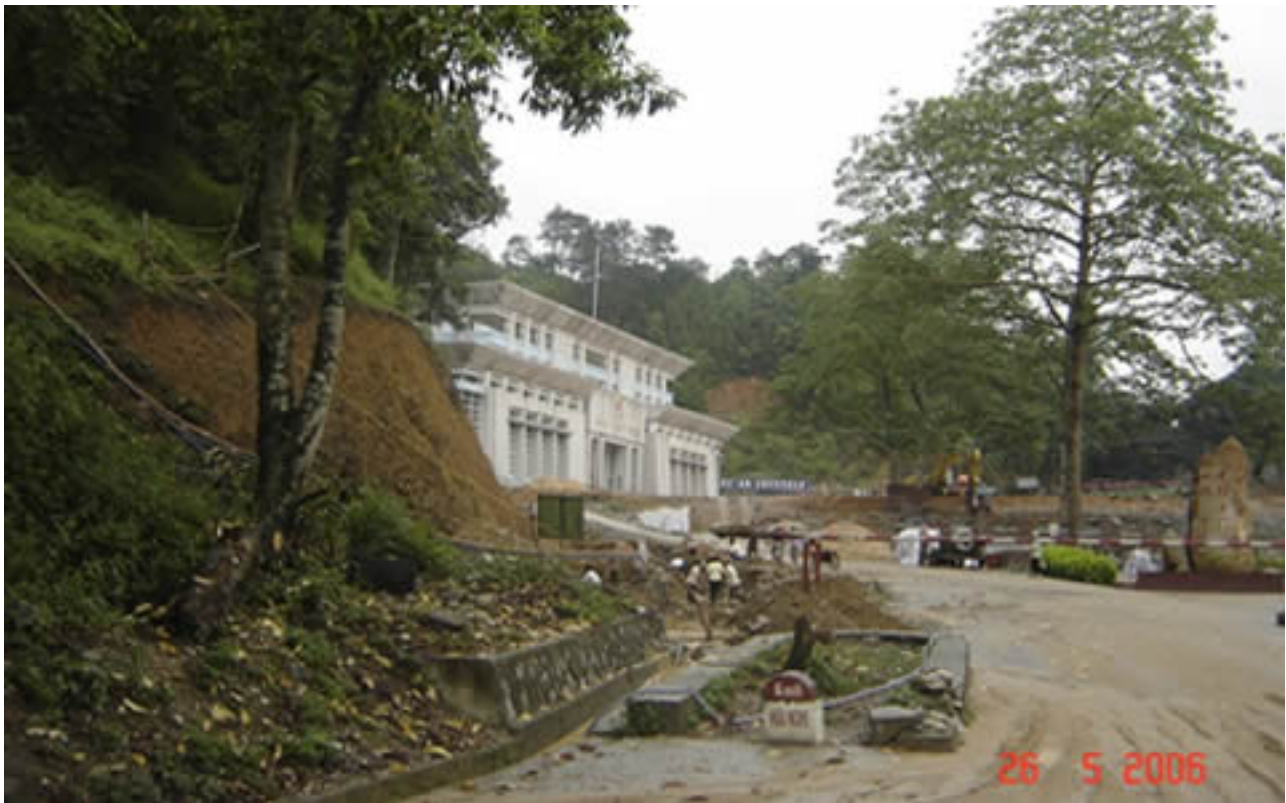
Hình G28 "Km0" của VN trở lại so sánh với bia đá "Nam Quan Quốc Môn" của Trung Quốc phía sau. Vị trí này ta không còn thấy của Nam Quan!

T&#225;c Gi&#7843;: Saigon Echo s&#225;t m Th&#7913; S&#225;u, 04 Th&#225;ng 12 N&#259;m 2009 15:21