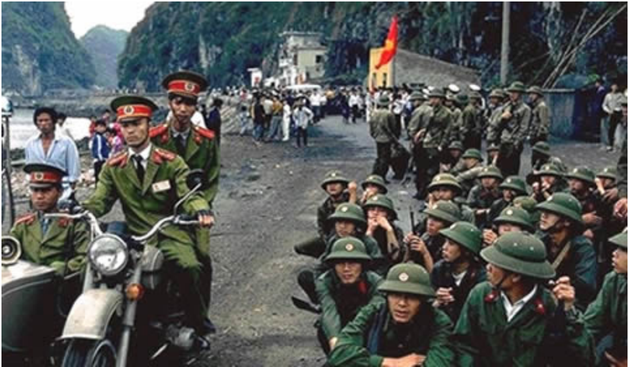
Hình G18 "Nam man! Ta cho ng&#225;i đ&#223; m ăn, áo m&#223; c, ta cho ng&#225;i súng đ&#223; n, nh&#223;ng chính ng&#225;i đ&#223; l&#223;y súng đ&#223; n b&#223;n vào da th&#223;t ta!" (ng&#225;i anh em đ&#223;ng chí TC nói!)

T&#225;c Gi&#7843;: Saigon Echo s&#225;u t&#225;m Th&#7913; S&#225;u, 04 Th&#225;ng 12 N&#259;m 2009 15:21