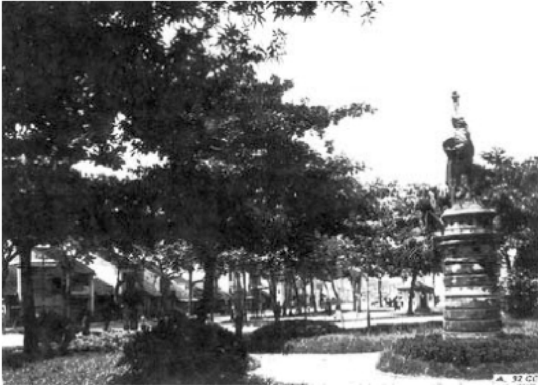
“Liberté sur le Pagodon du Petit - Lac à Hanoi” / Nguồn: Césard/ La Vie Indochinoise (12/1896)

Tài liệu gốc: Nguyễn Phúc Giác Hải Thư viện số, 14 Tháng 10 năm 2010 11:21