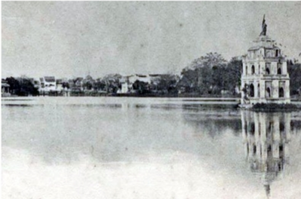
Tổn ng Th n T Do trên nóc Tháp Rùa

T&#225;c Gi&#7843;: Nguy n Phúc Giác H i Th&#7913; N&#259;m, 14 Th&#225;ng 10 N&#259;m 2010 11:21