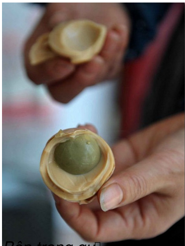
Bên trong quả... ..

Ch...250;a Nh...7853;t, 20 Th...225;ng 11 N...259;m 2011 06:58