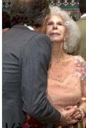
Và người hôn b&#225;nh phúc vào má.