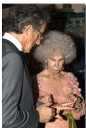
Hai người trao nhau nh&#225;n c&#225;i.

T&#225;c Gi&#7843;: Anh Ng&#225;c &Di&#225;u Minh Ch&#250;a Nh&#7853;t, 09 Th&#225;ng 10 N&#259;m 2011 06:04