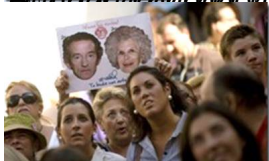
bi&#225; và đ&#225;c bi&#225;th&#225; Tây Ban Nha đã đ&#225;p trung tr&#225;c c&#225;ng nhà th&#225; Palacio de las