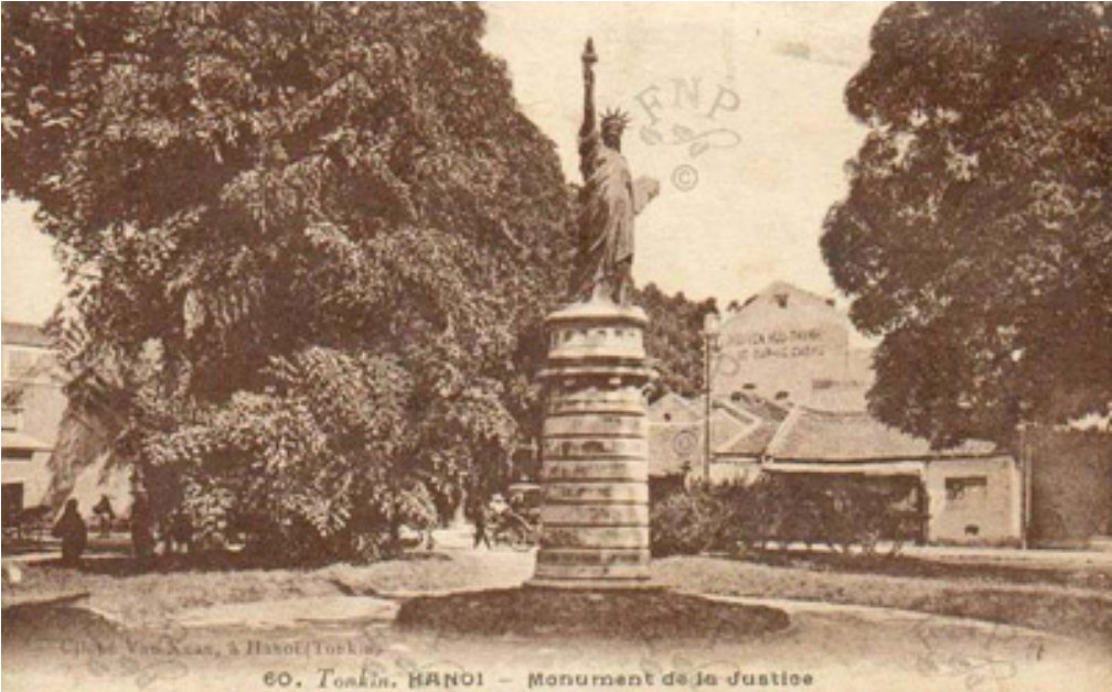
Cit. de Van Xuan, à Hanoi (Tonkin) 60. Tonkin, HANOI - Monument de la Justice

T&#225;c Gi&#7843;: Saigon Echo s&#223; u t&#223;m Th&#7913; Ba, 23 Th&#225;ng 2 N&#259;m 2010 08:06