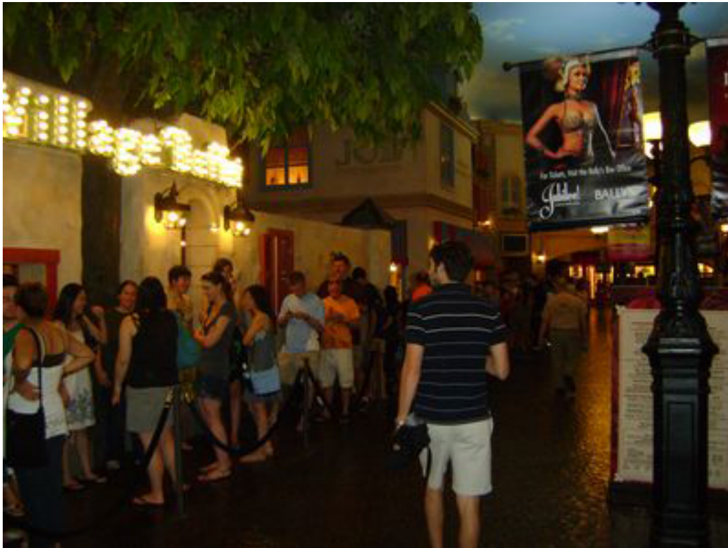
Thức khách sạn hàng chờ vào The Village Buffet.

T&#225;c Gi&#7843;: Bài Và ình :Trình Hồ o Tâm Th&#7913; Hai, 08 Th&#225;ng 11 N&#259;m 2010 16:06